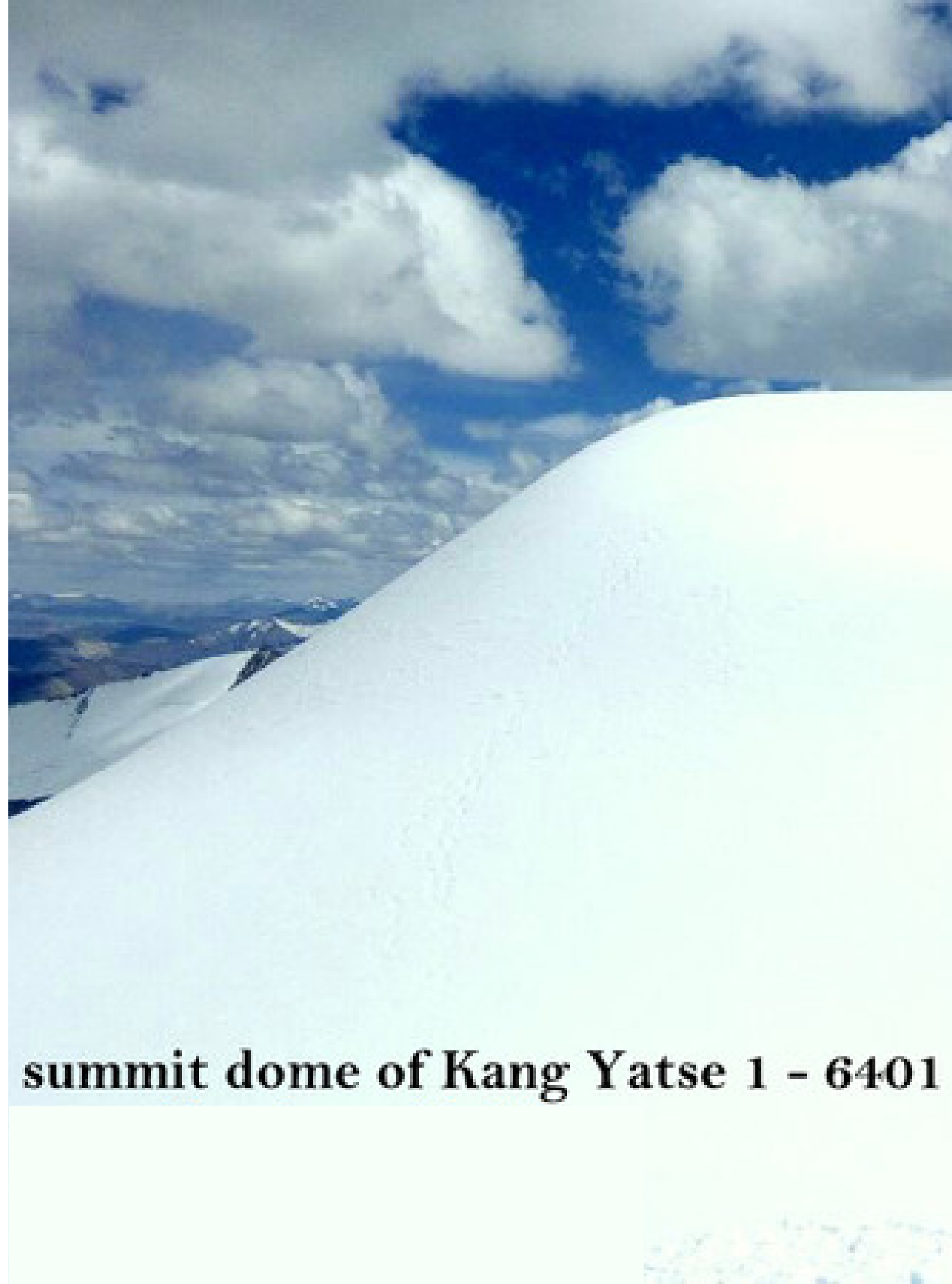
summit dome of Kang Yatse 1 - 6401

در اینجا هر دو را خواهید داشت، یکی از زیباترین دره های لداخ و قله ای بیش از 6000 متر که ان را صعود می کنید. شما تجربه خواهید کرد که چرا این یکی از زیباترین سفرهای کوهنوردی به یک قله است، با کنار گذاشتن نکات فنی.